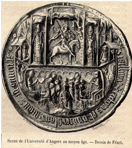
Seau de l'Université d'Angers au moyen âge. — Dessin de Féart.

Το Πανεπιστήμιο της Angers έχει μακράιωνη παρουσία. Η ιστορία του ξεκινά στον 11ο αιώνα, όταν ιδρύεται το κέντρο ανώτατων σπουδών που ονομαζόταν «Étude» ή «École» της Angers. Το 1337, ονομάστηκε πανεπιστήμιο ( studium ) και ήταν το πέμπτο σε σειρά που δημιουργήθηκε στη Γαλλία (μετά το Παρίσι, την Ορλεάνη, την Τουλούζη και το Μονπελιέ). Αρχικά αποτελούμενο από τη Σχολή Δικαίου, το ίδρυμα διευρύνθηκε το 1432 με τη δημιουργία των Σχολών Ιατρικής, Τεχνών και Θεολογίας. Στο τέλος του 15ου αιώνα, το πανεπιστήμιο είχε περίπου 1.000 φοιτητές.